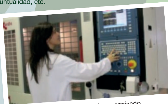
Modernos centros de mecanizado